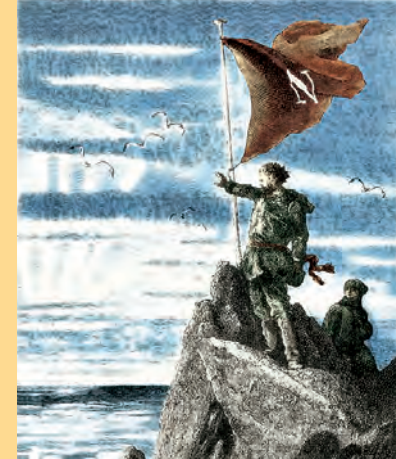
September Artikel-Nr: 8/302