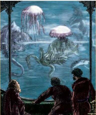
März Artikel-Nr: 8/96