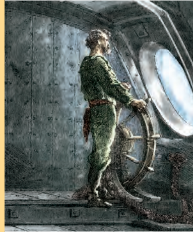
Mai Artikel-Nr: 8/221