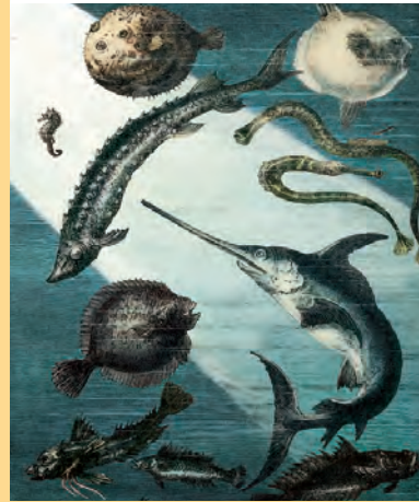
Juni Artikel-Nr: 8/234