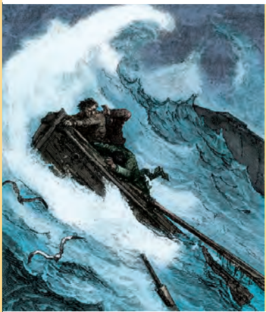
Dezember Artikel-Nr: 8/364