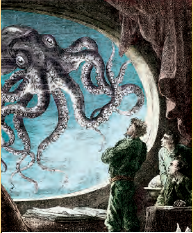
Oktober Artikel-Nr: 8/331