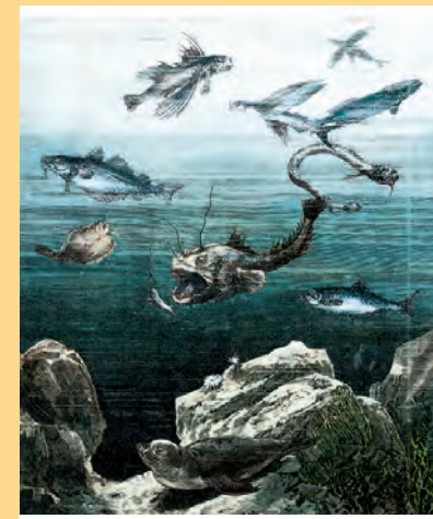
Juli Artikel-Nr: 8/235