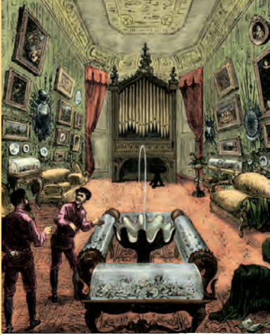
Januar Artikel-Nr: 8/76