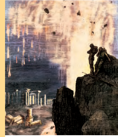
August Artikel-Nr: 8/255