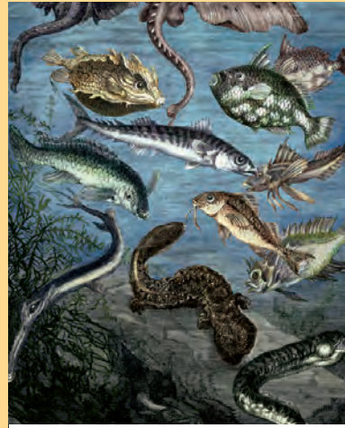
April Artikel-Nr: 8/98